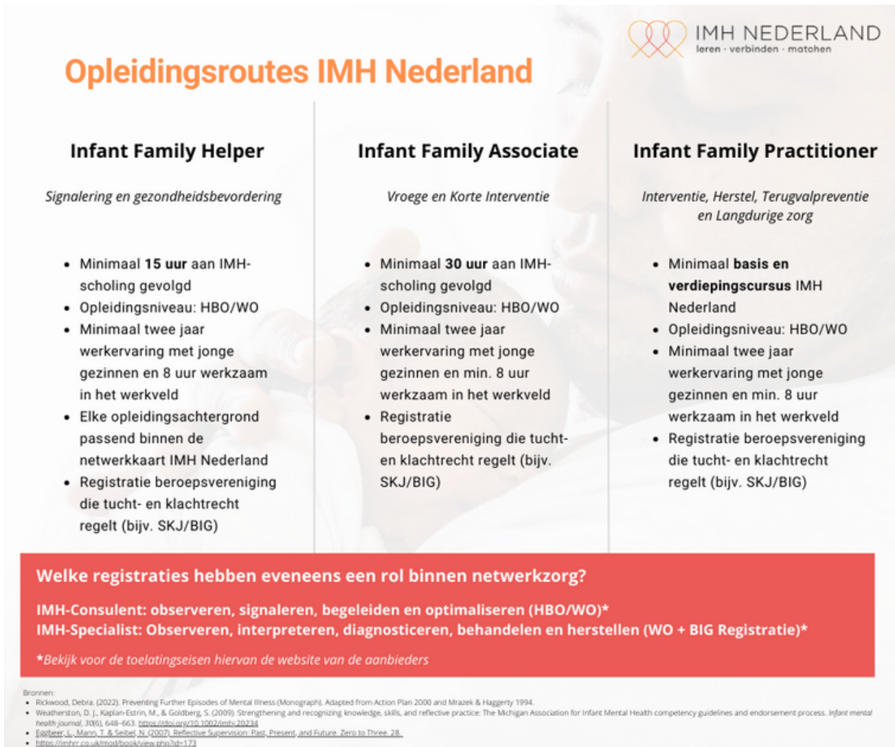
Figuur 5: registratiemodel Infant Mental Health