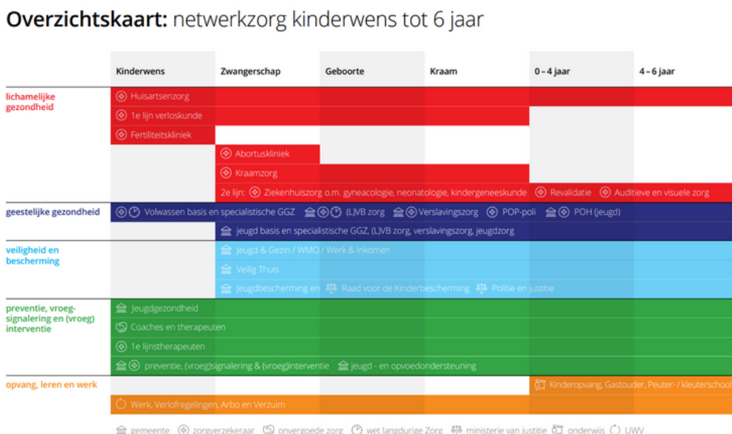
Figuur 1: IMH Nederland overzichtskaart werkvelden

Die verbinding wordt door IMH Nederland actief gestimuleerd, door op meerdere niveaus en via meerdere activiteiten in te steken. We nemen daarbij het verandermodel van John Kotter (1996) als uitgangspunt, zodat er een onderbouwing is hoe je tot verandering komt. Bij dit model wordt de wens om te veranderen en de motivatie van de professional steeds centraal gesteld. Het model van netwerkzorg zet aanvullend ook de wens van de klant centraal.